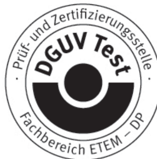
Unterschrift (Dipl.-Ing. Vogl)

Diese Bescheinigung einschließlich der Berechtigung zur Anbringung des GS-Zeichens ist gültig bis: 21.03.2015